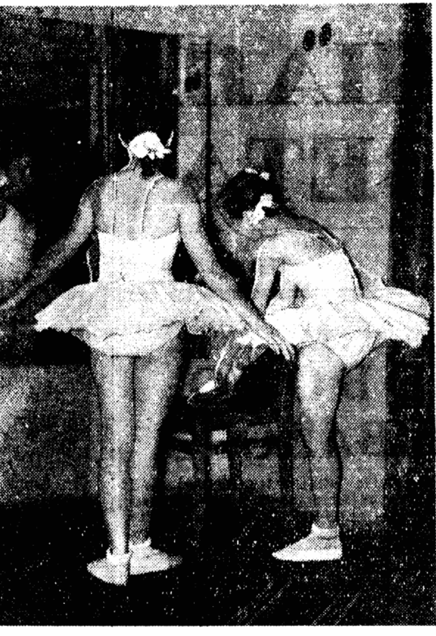
И в хореографическом коллективе Дома культуры завода «Науучи» есть свои Улановы.