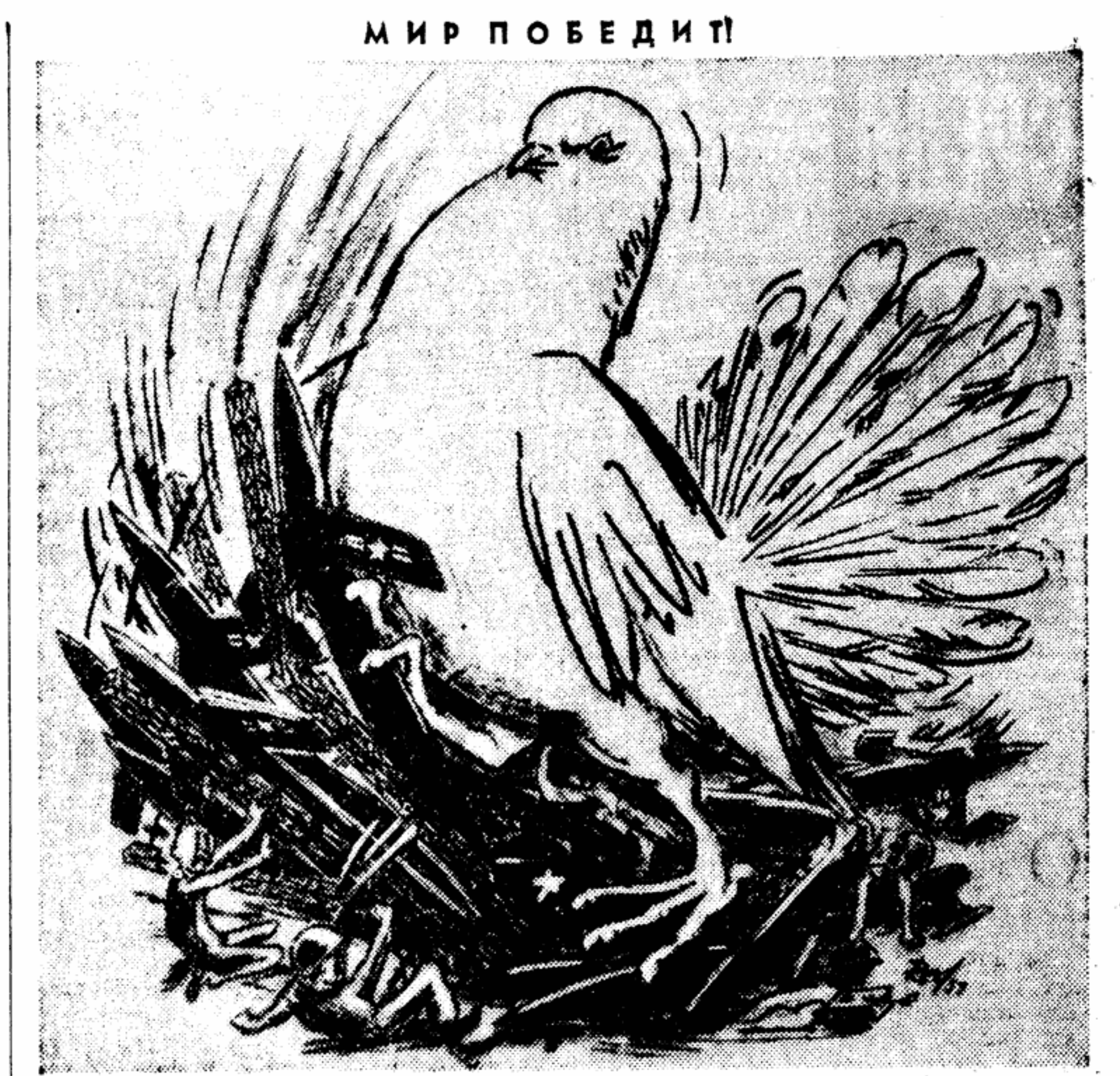
Рисунок немецкого художника Бейера-Ред из журнала «Бильдеде кунст»