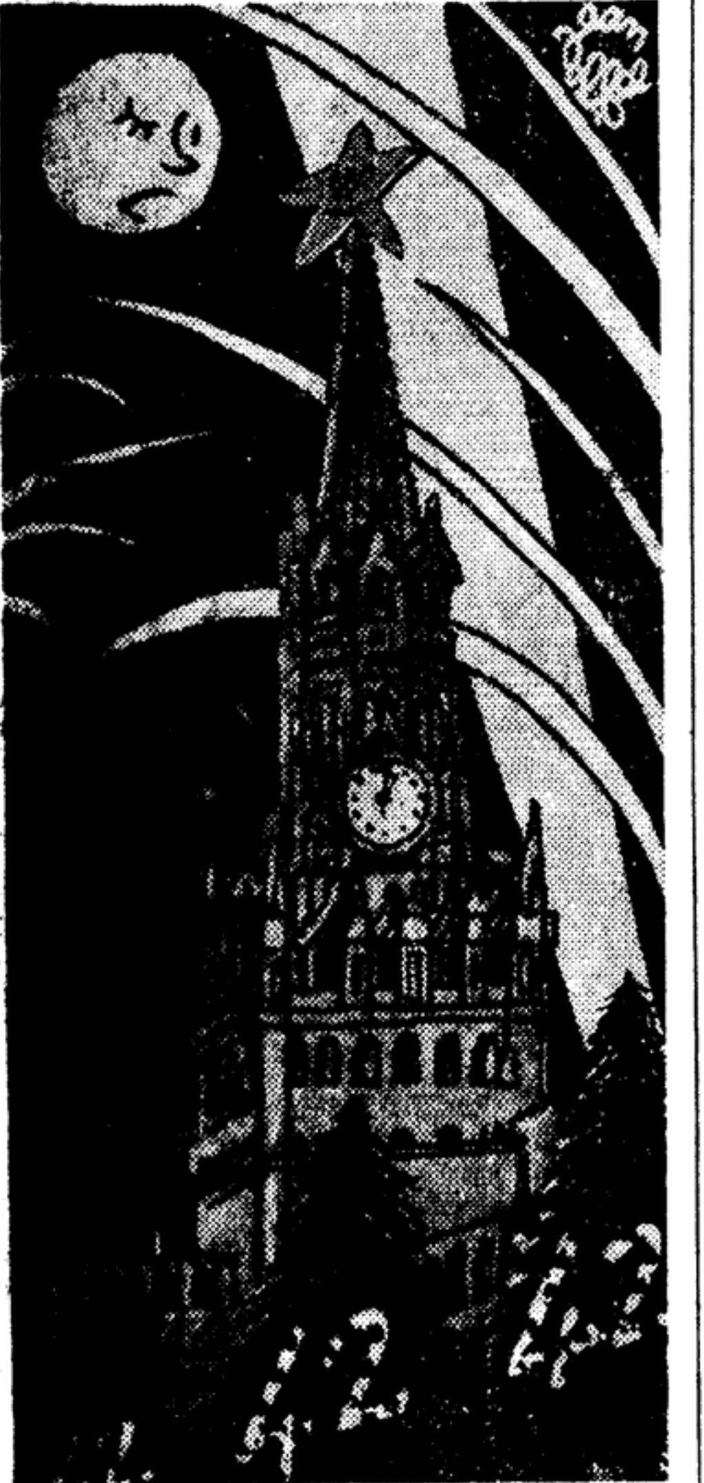
ЛУНА: Все выше и выше взлетают вышки праздничных огней. В этом году дано мне в глаза залетела искра... Рисунок художника Жана Эффеля из французской газеты «Юнайтедманш».