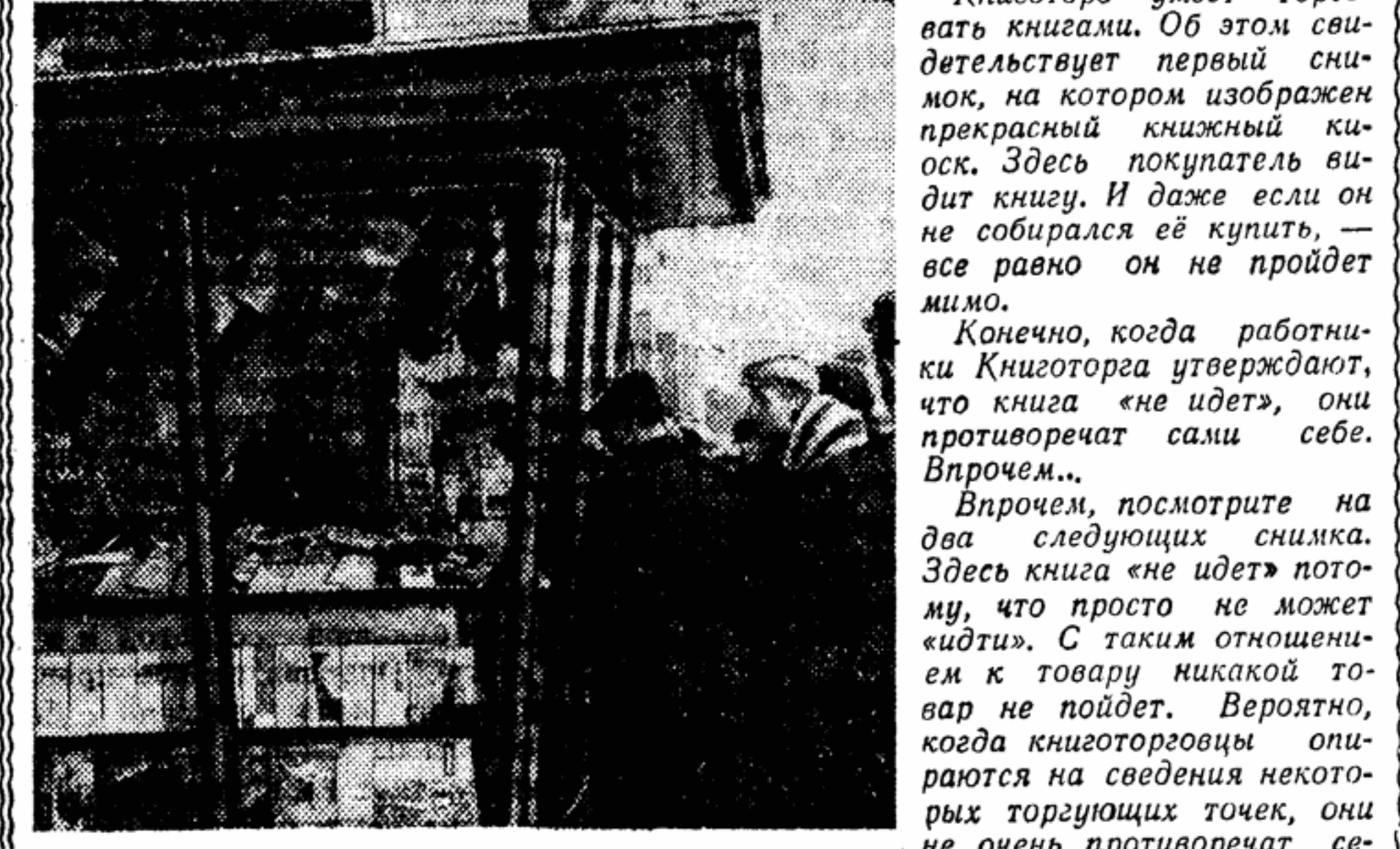
Журнально-газетный киоск на площади Свердлова в Москве.